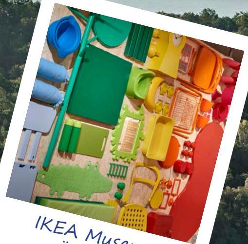
IKEA Museum Älmhult